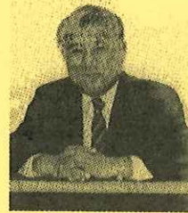
NPO 日本教育カウンセラー協会 会長 國分 康孝

日時 2018年 6月 9日(土)・6月 10日(日)・6月 17日(日) 9:30 ~ 16:30 (最終日は 17:00 終了) 3日間 総計 18時間